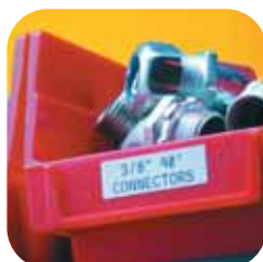
Štítky na policích a přihrádkách