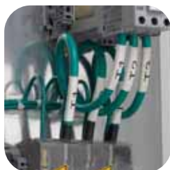
Smršťovací návlečky pro označování vodičů