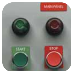
Spínací tlačítka, gravírované štítky EPREP