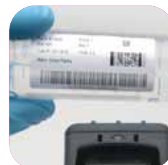
Identifikace v laboratořích a ve zdravotnictví