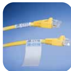
Identifikace vodičů a kabelů